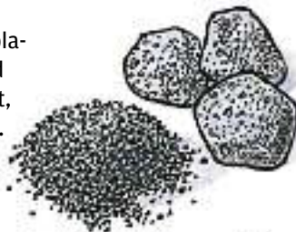
Schwarzer Sand aus Vulkangestein

Wenn sich auf den Sandschichten andere Gesteine ablagern oder grosse Wassermassen Druck ausüben, wird der Sand so stark zusammengepresst und entwässert, dass er - in Jahrtausenden - wieder zu Sandstein wird.